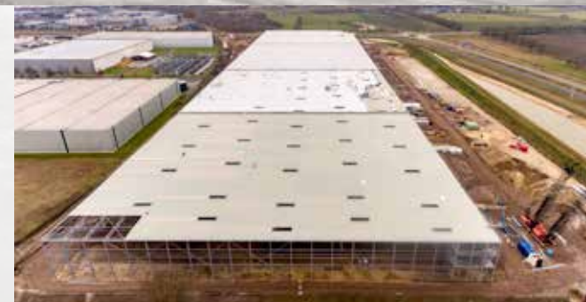
Bijzonder is de lengte, die bedraagt 426 meter.

begin september werd door derden het gebied bouwrijp gemaakt, legt Koen Backx uit. “Er is onder meer een sloot verplaatst en er zijn nieuwe watergangen aangelegd voor regenopvang. Bovendien zijn er enkele bomen verwijderd, maar die worden elders teruggeplaatst. Er is sowieso uitgebreid flora- en faunaonderzoek gedaan, waaruit een ecologisch plan is voortgekomen.” De fundering, maakt Theo van der Sluis vervolgens duidelijk, is inmiddels gereed. Hij geeft aan dat het gebouw een totale oppervlakte heeft van 60.000 m 2 en is verdeeld in vier compartimenten variërend van 13.000 tot 18.000 m 2 . “Bijzonder is de lengte, die bedraagt 426 meter.” De compartimenten A, B en C, zegt hij, moeten op 1 april klaar zijn, inclusief een supervlakte betonvloer. “Vanaf dat moment begint de huurder, XPO Logistic, met het inrichten van